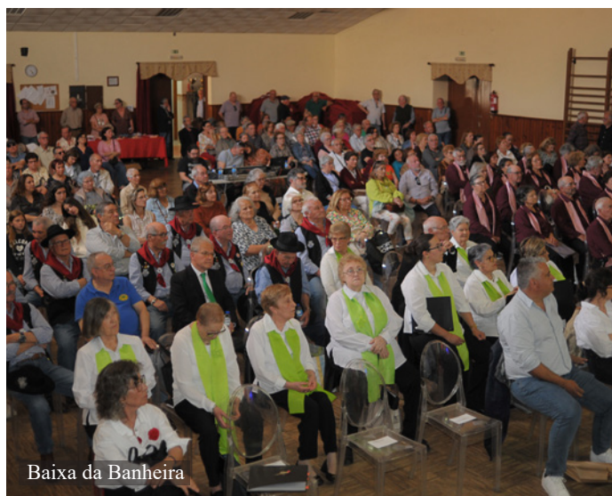
Baixa da Banheira

de 30.000 presos políticos, e os horrores da guerra colonial.